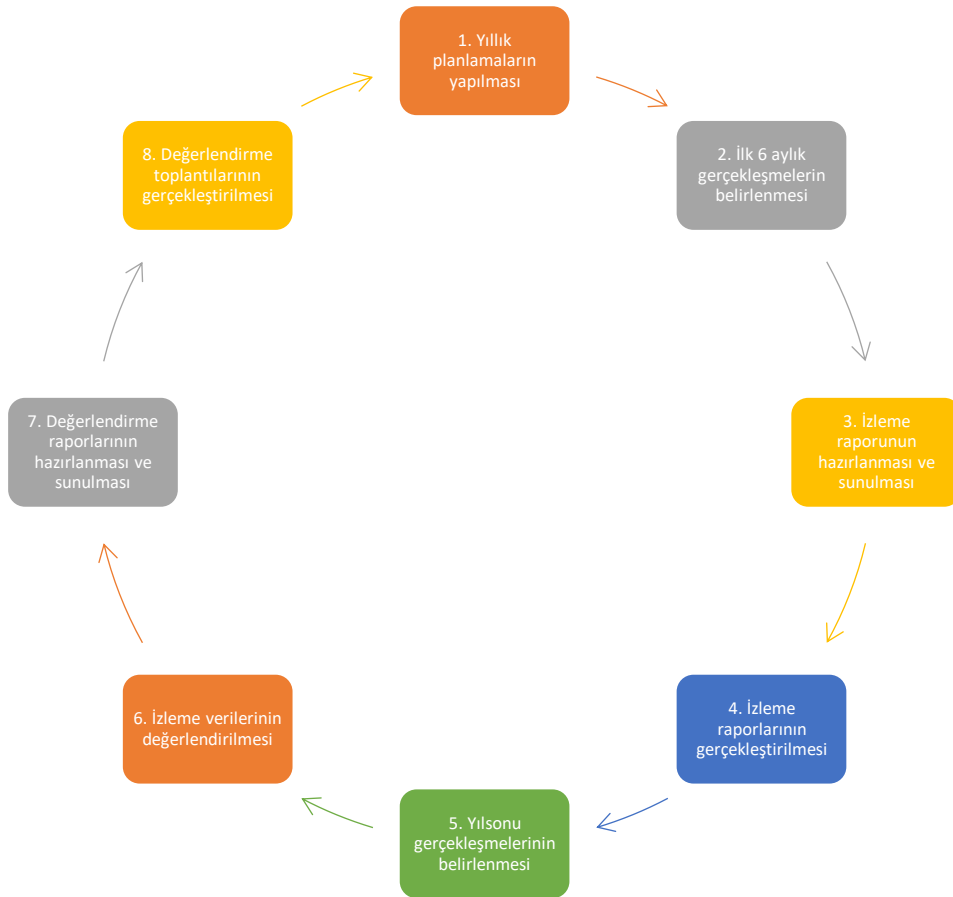
Tablo 30: İzleme ve Değerlendirme Süreci Tablosu

İzleme ve değerlendirme sürecinin işleyişi ana hatları ile aşağıdaki şekilde özetlenmiştir. Okulumuz 2024–2028 Stratejik Planı'nda yer alan performans göstergelerinin gerçekleşme durumlarının tespiti yılda iki kez yapılacaktır. Ara izleme olarak nitelendirilebilecek yılın ilk altı aylık dönemini kapsayan birinci izleme kapsamında, performans göstergeleri ve stratejiler ile ilgili gerçekleşme durumlarına ilişkin veriler toplanarak konsolide edilecektir. Performans hedeflerinin gerçekleşme durumları hakkında hazırlanan “Stratejik Plan İzleme Raporu” kurum amirlerinin bilgisine sunulacaktır. Bu aşamada amaç, varsa öncelikle yıllık hedefler olmak üzere, hedeflere ulaşılmasının önündeki engelleri ve riskleri belirlemek ve yıllık hedeflere ulaşılmasını sağlamak üzere gerekli görülebilecek tedbirlerin alınmasıdır. Yılın tamamına ilişkin ikinci izleme kapsamında ise ilgili birimlerden sorumlu oldukları performans göstergeleri ve stratejiler ile ilgili yıl sonu gerçekleşme durumlarına ait veriler toplanarak konsolide edilecektir.